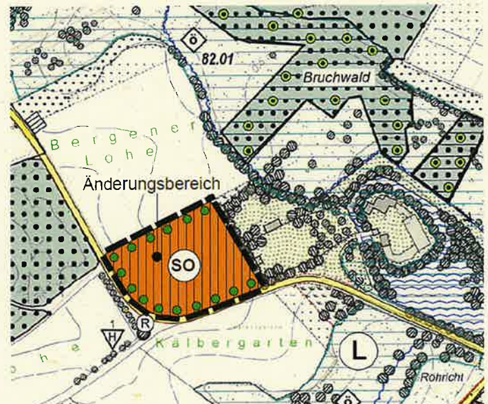
8. Änderung Flächennutzungsplan