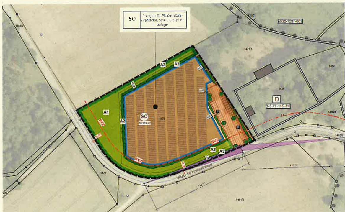
Geltungsbereich des sich in Aufstellung befindlichen vorhabenbezogenen Bebauungsplans Thalmannsfeld Nr. 9 „Freiflächenphotovoltaikanlage Schloss Syburg“