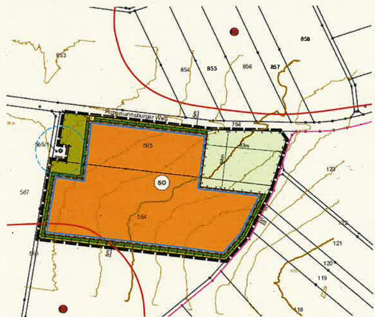
Geltungsbereich des sich in Aufstellung befindlichen vorhabenbezogenen Bebauungsplans Thalmannsfeld Nr. 8 „Solarpark Thalmannsfeld“

Der Geltungsbereich des Bebauungsplans umfasst die Flnr.254 und 565, Gemarkung Thalmannsfeld und hat eine Flächengröße von ca. 3,19 ha. An den Geltungsbereich grenzt nördlich der Ruppmannsburger Weg, östlich und westlich grenzt je ein Flurweg und südlich eine landwirtschaftlich genutzte Fläche an.